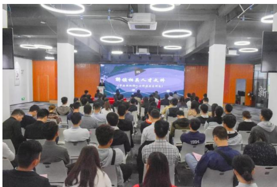
参会人员了解我市相关情况