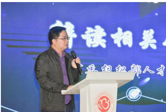
市委组织部人才科解读相关人才文件

2019年2月18日，举办茂名市高端人才交流会，该活动由中共茂名市委组织部和共青团茂名市委员会共同主办，茂名市人才驿站、茂名市大学生成长促进会联合承办。本届高端人才交流会聚集近100名来自985、211双一流大学和海外留学的博士、硕士研究生，部分本科学生。交流会分别邀请市科协朱健超副主席介绍茂名近年的经济发展概况、市委组织部人才科解读市内相关人才引进政策。同时也吸引了30多家高新企事业单位参会，为本次交流会提供200多个高端岗位。现场初步达成就业意向67人次。